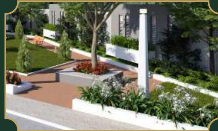
एक्यूप्रेशर व योगा गार्डन