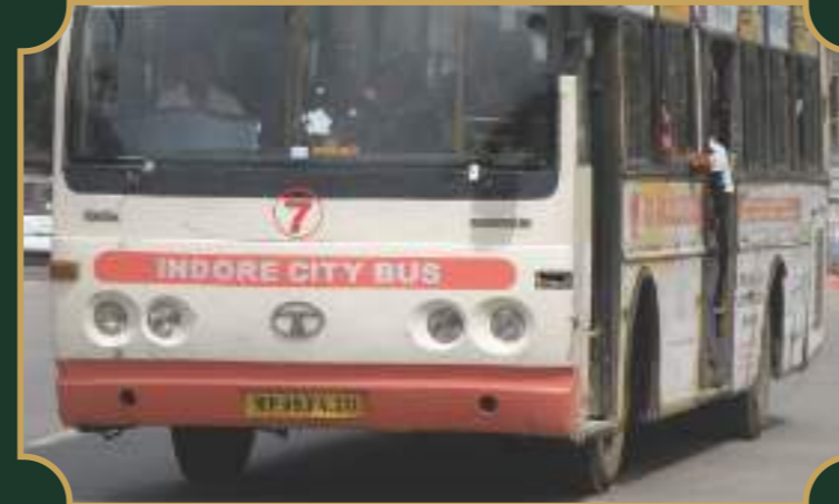
मेन रोड से सिटी बस सुविधा