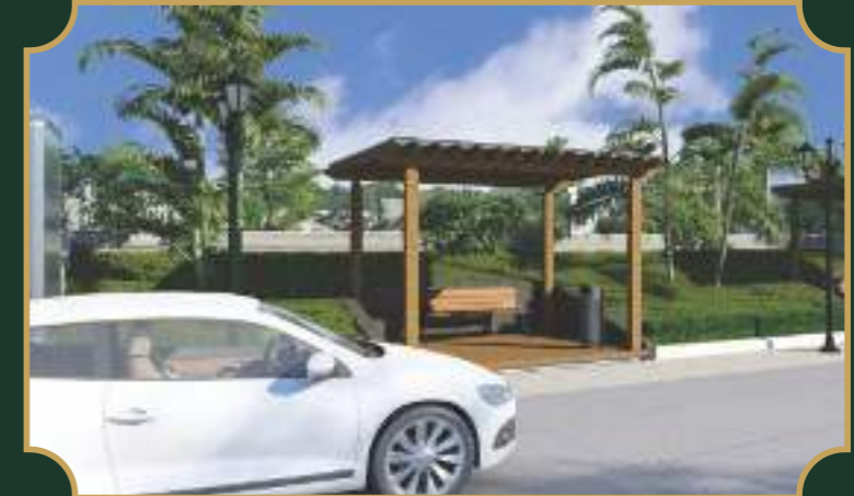
चौडी सड़कें व स्ट्रीट लाइट्स