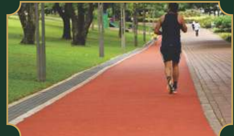
साईकल व जॉगिंग ट्रैक