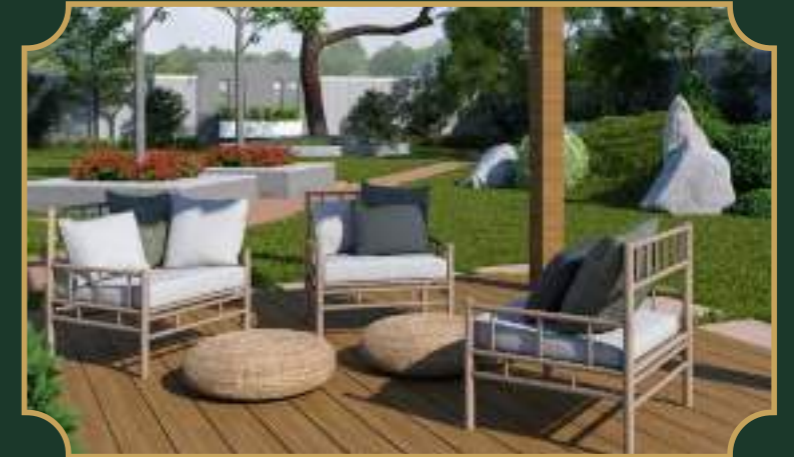
सीनियर सिटिजन पार्क