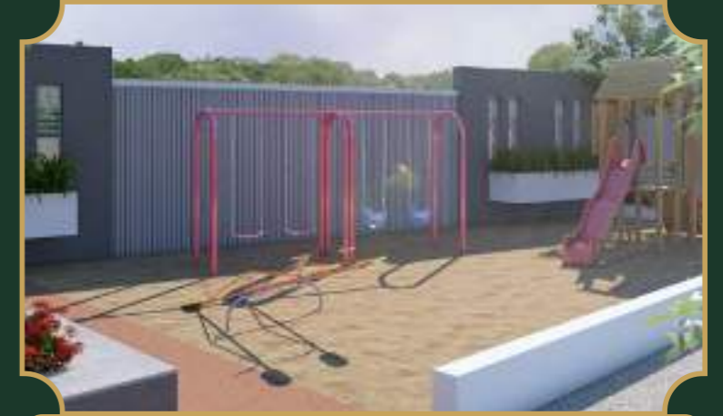
किड्स प्ले जोन