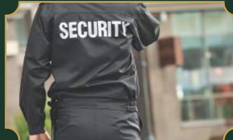
24 घण्टे सुरक्षा गार्ड