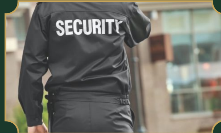
24 घण्टे सुरक्षा गार्ड