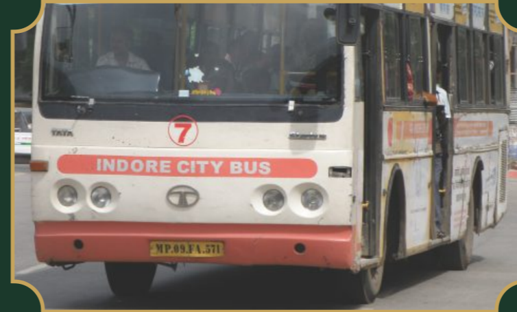
मेन रोड से सिटी बस सुविधा