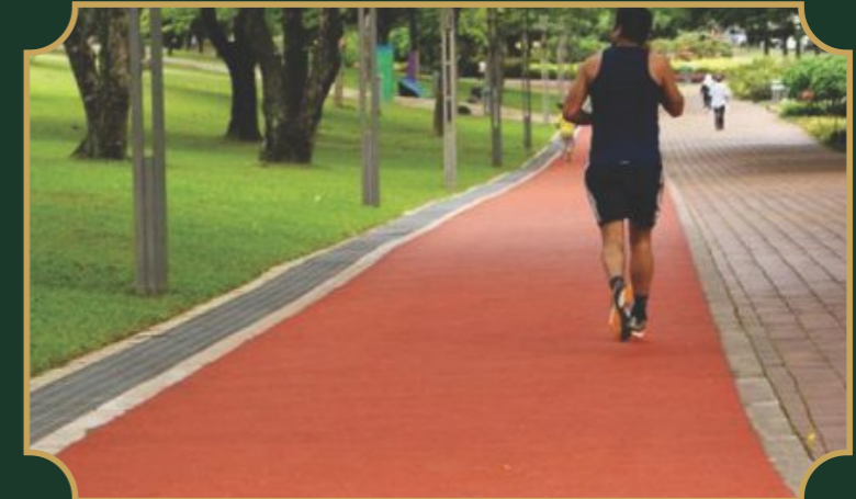
साईकल व जॉगिंग ट्रैक