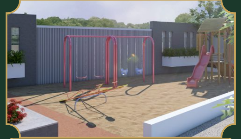
किड्स प्ले जोन