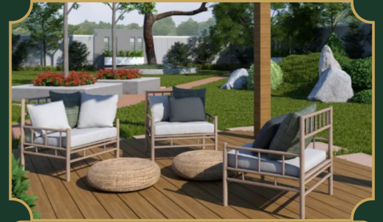
सीनियर सिटिजन पार्क