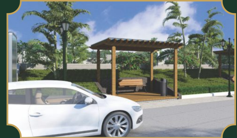
चौडी सड़कें व स्ट्रीट लाइट्स