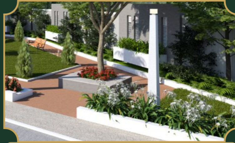
एक्यूप्रेशर व योगा गार्डन